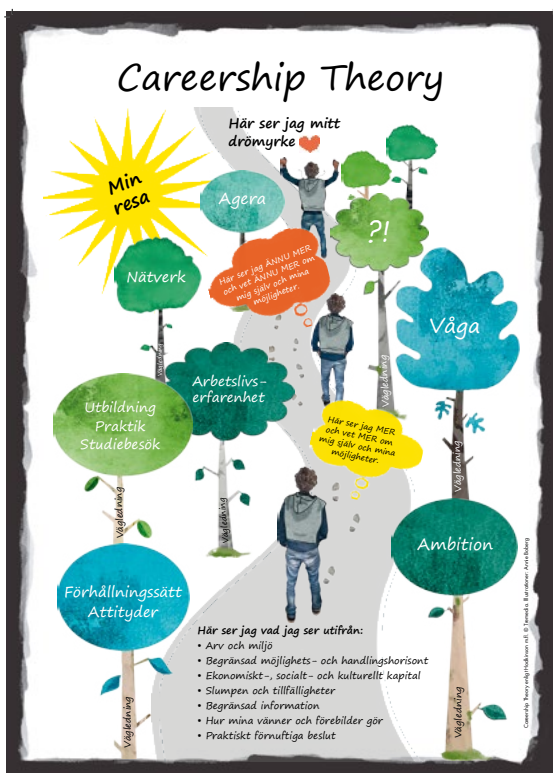
Figur: Careershipteorin (Hodkinson & Sparkes)