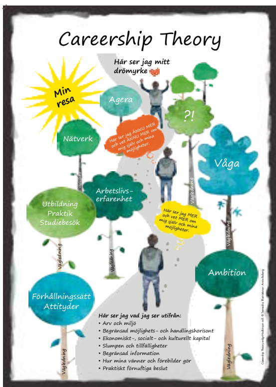
Figur: Careershipteorin (Hodkinson & Sparkes)